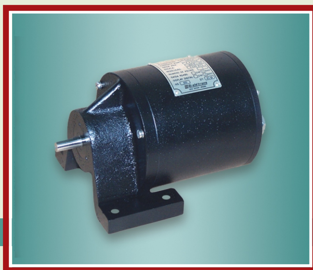
Modelo: GP - DI9040